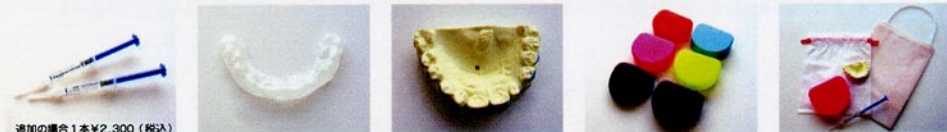
追加の場合1本¥2,300(税込)

あなたの歯の形に合わせた専用のトレー(マウスピース)を作ります。 ご自宅でトレーに特殊ジェルを入れ、毎日数時間装着するだけ！